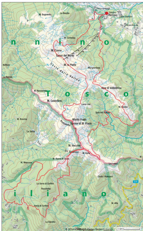
Trasa trekkingowa 1. Dzień 3-6: Febbio - Monte Cusna - Monte Prado - Pania di Corfino - Alpe di Vallestrina - Il Passone - Febbio