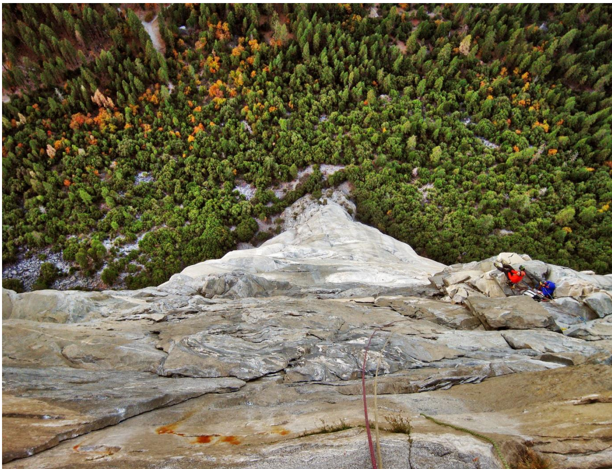
Zespół tuż po biwaku podczas przejścia drogi The Nose na El Capitan, około 600 m nad ziemią.