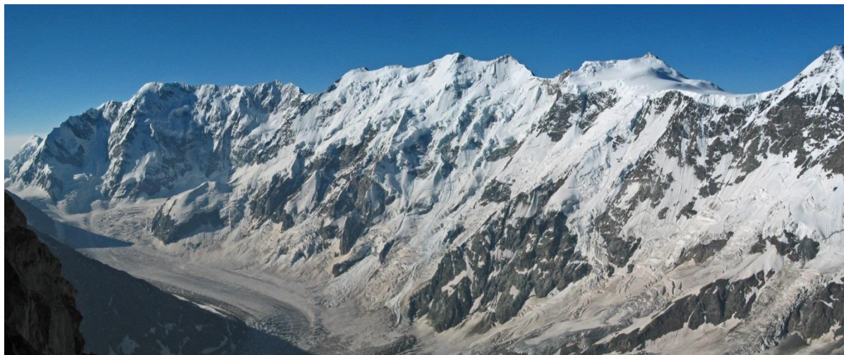
Panorama wschodniej części "Muru Bezengi".

Pasma Kaukazu to góry na granicy Europy i Azji. Grań główna stanowi również granicę między Rosją, Gruzją i Azerbejdżanem. Rejon Bezengi w Kaukazie Centralnym zwany jest przez wielu "Małymi Himalajami". O powadze rejonu świadczy fakt, że dawniej mogli w nim działać tylko wspinacze I stopnia w systemie szkoleniowym byłego ZSRR, czyli na ugruntowanym poziomie dróg