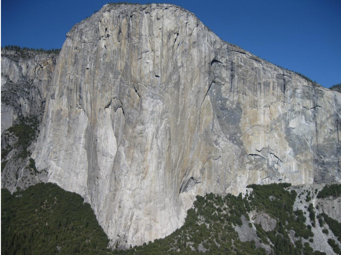
El Capitan – 890 metrów wysokości.

Dolina Yosemite to bez wątpienia światowa mekka wspinania wielkościanowego. Ogromne granitowe ściany oferują wyzwania zarówno we wspinaczce klasycznej jak i hakowej, często wymagające spędzenia kilku dni w ścianie.